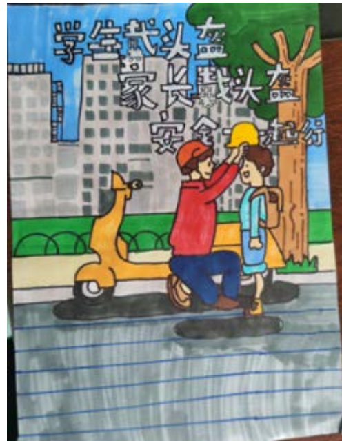
交通安全宣传图 李闻秋 国学实验小学