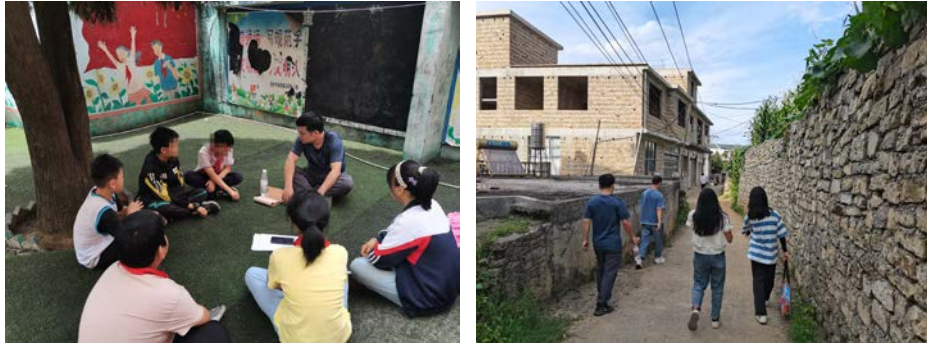
左图：在学校的操场上开展受益儿童回访 右图：前往受益孩子家中进行回访的路上