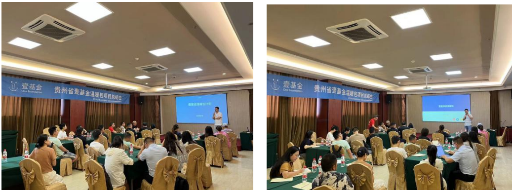
上图：贵州省 2022 年度温暖包项目总结会会议现场

会议现场，壹基金温暖包项目主要负责人主要针对项目整体概况、项目参与方式、项目执行、筹资方向等几方面内容进行介绍。另外，增加了关于项目升级迭代的共创环节，贵州当地的社会组织伙伴从壹基金温暖包物品更新和项目管理流程优化两个角度，提供宝贵意见。