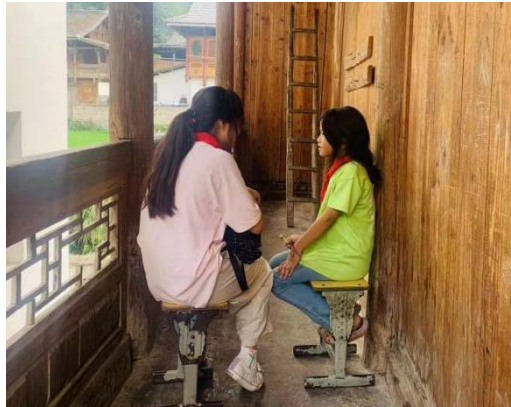
温暖包项目第三方评估团队对受益孩子进行访谈

从小到大爸爸妈妈从来没有给我和弟弟妹妹买过任何玩具，一年级的時候，有一群叔叔阿姨们为我们送来了一个大箱子，里面有娃娃、书包、衣服、围巾，我最喜欢的是那个“娃娃”，我给她取名叫“小花”，它是我的宝宝。“小花”是温暖包物品中的玩偶兜兜；我的妹妹是小花的外婆，弟弟是小花的外公，我们经常在家给“小花”做大餐——红烧牛肉，就是用树叶和瓦片做的美食。每天早上我都会给它盖好小被子再去上学，晚上睡觉的时候还会哄她睡觉“宝宝快快睡”。平常周末的时候我喜欢背着“小花”去赶集，给她买好吃的，我还喜欢给“小花”做小“衣服”。我同村的好朋友也有收到娃娃的，她们都是“小花”的舅妈、婶婶和姑姑们，我们经常带自己的宝宝走亲戚。我的小心愿就是还想为我的宝宝找个“小妹妹”。