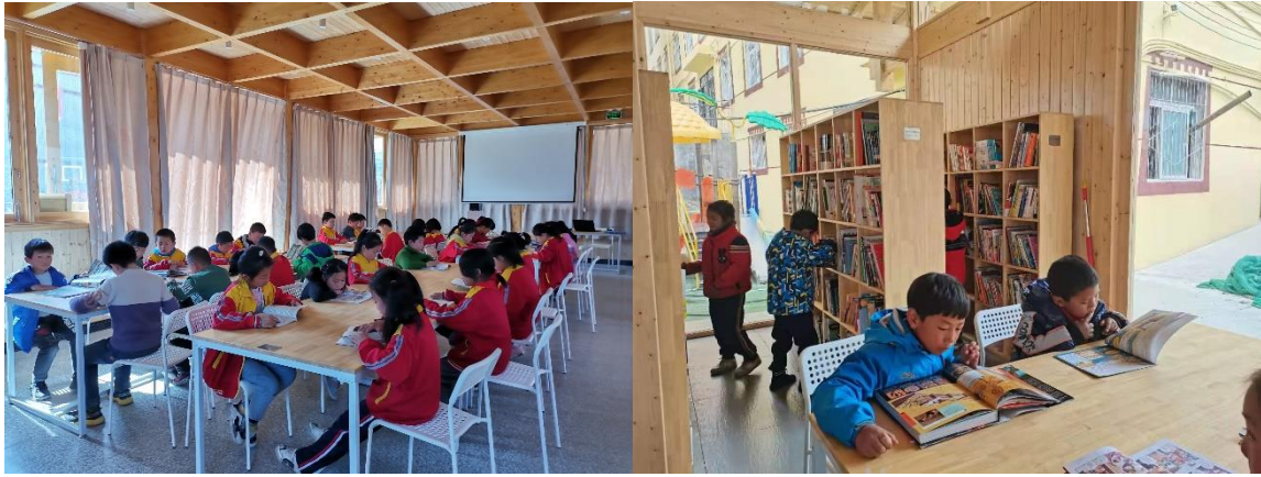
贵州、四川等地项目校同学正在认真阅读