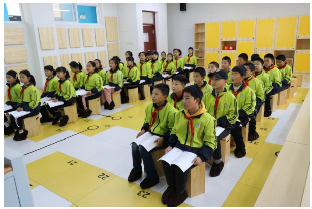
走访项目学校北董小学（左）、湖景小学（右）等学校，寓教于乐的音乐课