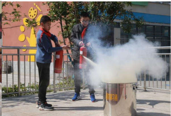
合肥市凤凰城小学 学生在消防安全课上体验用消防器材灭火 执行机构：安徽省广善公益服务中心