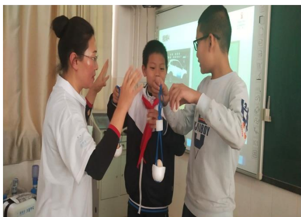
文山市第八小学 交通安全课程上学生做鸡蛋头盔坠地实验 执行机构：文山州社会工作促进会