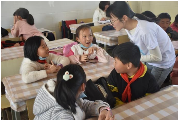
曲靖市麒麟区益宁街道花柯小学 四年级消防安全课老师倾听学生讨论 执行机构：曲靖市初心社会工作服务中心

截至 3 月 31 日，儿童平安小课堂累计在全国 727 所学校累计开展安全教育课程 11,965 节，共有 519,006 人次的学生参与其中。