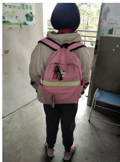
三岩小学-林梦婷制作反光条学生作品 指导老师：王文雅 执行机构：台州市春雨公益协会