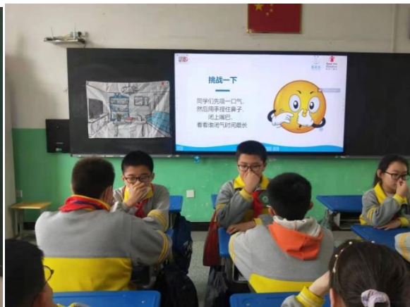
石嘴山市第十一小学 防溺水课程上小学生体验憋气 执行机构：大武口去善信公益服务中心