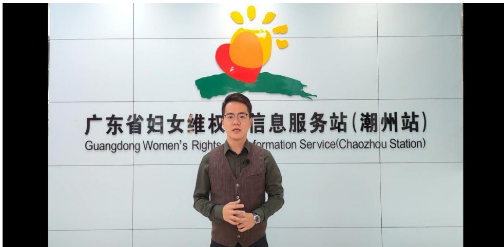
线上微课视频截图

2021年2月，完成以下工作：1) 协调安排值班驻点人员进行值班服务，并接待部分个案咨询。2) 公益讲师协调确定线上讲座主题和内容，准备文稿，完成3个线上微课视频录制。3) 和市妇联协商好其公众号档期，发布相应的公众号推文，并由森凯律所等公众号转发推广。4) 借助潮州市妇联在潮州电台开辟的“妇联好声音”栏目宣传本项目的相关情况。