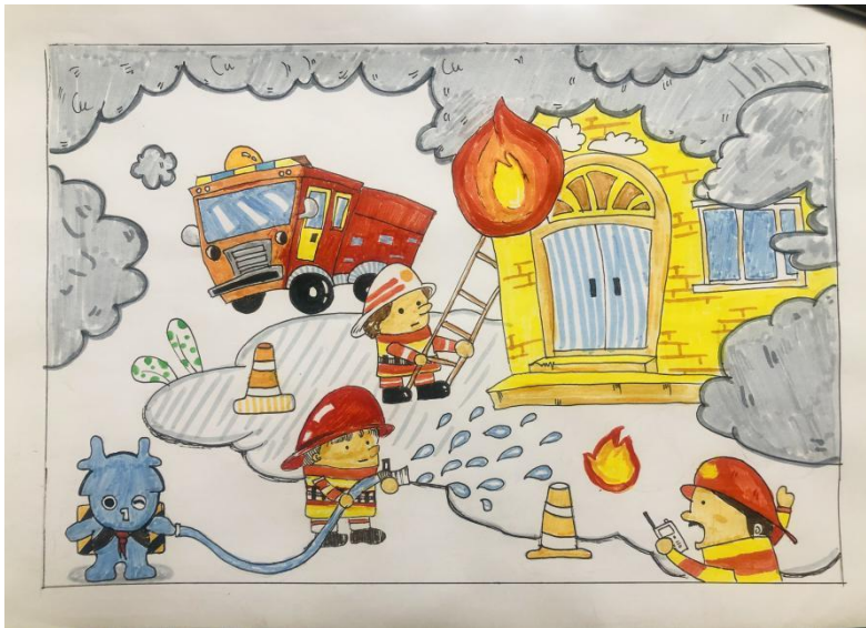
前郭县额如乡中心小学学生于梓作品 执行机构：吉林松原市海洋之家志愿者协会