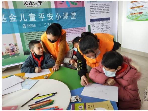
社区内讲授防溺水课程，家长和孩子共同参与 执行机构：塔城市和谐园社会工作服务中心