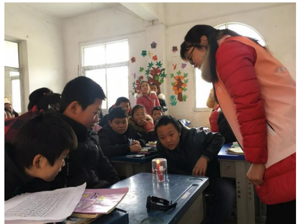
大悟县东新乡中心小学，消防安全课程 学生们在观察隔绝氧气情况下，火的变化 执行机构：大悟县乐成社会工作服务中心