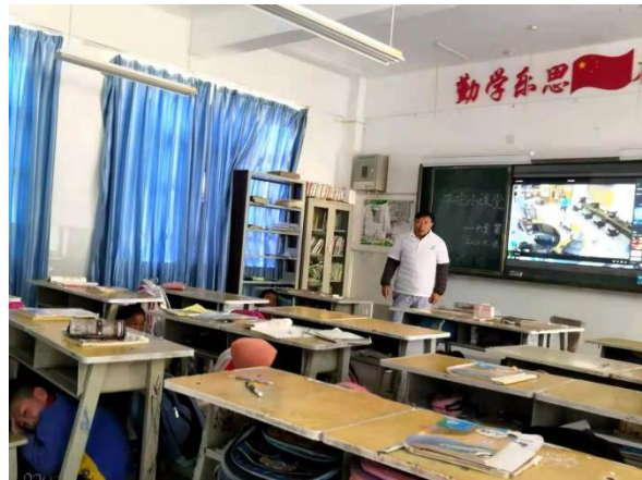
会泽县钟屏街道鱼洞小学，地震课程 学生们在体验如何应对地震 执行机构：会泽县泽恩社会工作服务中心