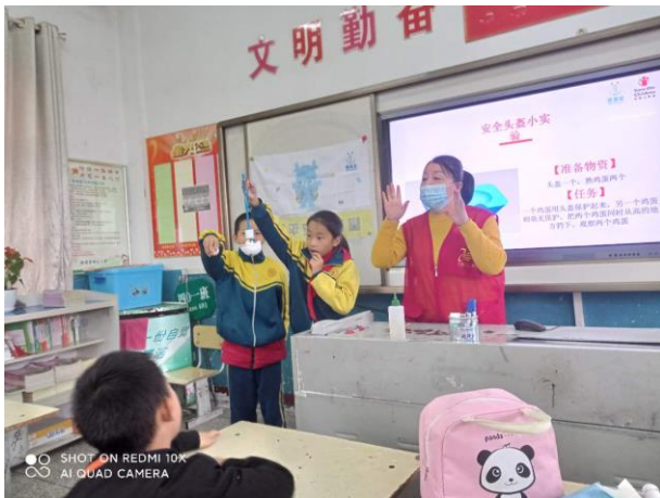
孝南区卧龙中心小学，交通安全课程 学生们在进行安全头盔实验 执行机构：孝感市义工联合会

截至 2021 年 2 月 25 日，儿童平安小课堂累计在全国 727 所学校累计开展安全教育课程 11,099 节，共有 484,571 人次的学生参与其中。