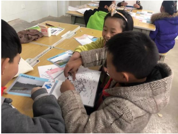
会泽县钟屏街道鱼洞小学，防溺水课程 学生们在分组讨论哪种情境更安全 执行机构：会泽县泽恩社会工作服务中心