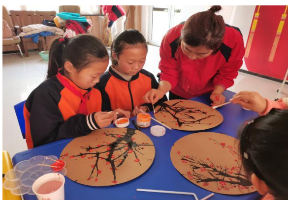
勇士社区儿童服务站开展儿童手工画活动