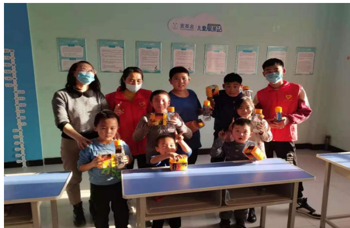
站点老师及志愿者为孩子们发放迪士尼礼品