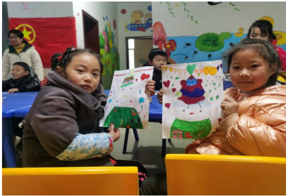
红石坡社区儿童服务站“雪人”主题活动现场