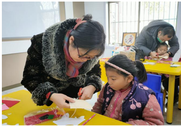
长沟镇儿童服务站开展“非遗小课堂”特色活动现场