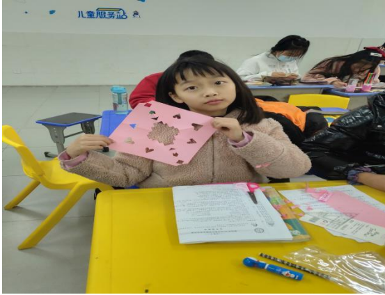
满庭春社区儿童服务站“剪纸”主题活动现场