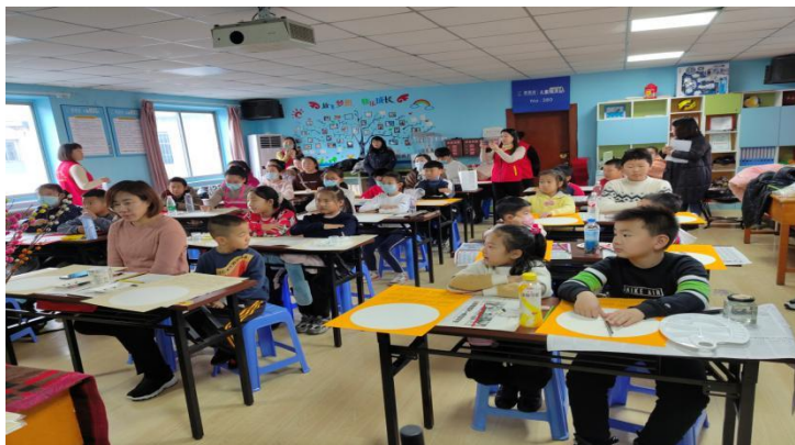
孩子们在上手绘台历课程中