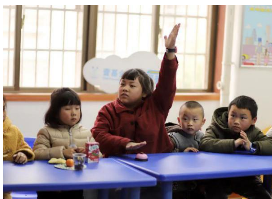
窑塘社区儿童服务站“疫时间——趣味知识问答”活动现场