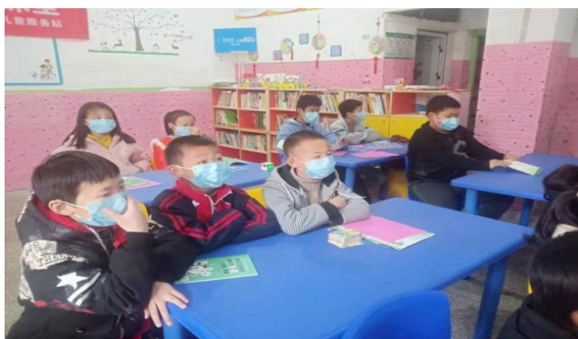
孩子们在参与“预防新冠病毒知识小课堂”活动