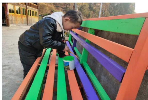
石阡县国荣站点儿童服务站“旧家具改造”活动现场