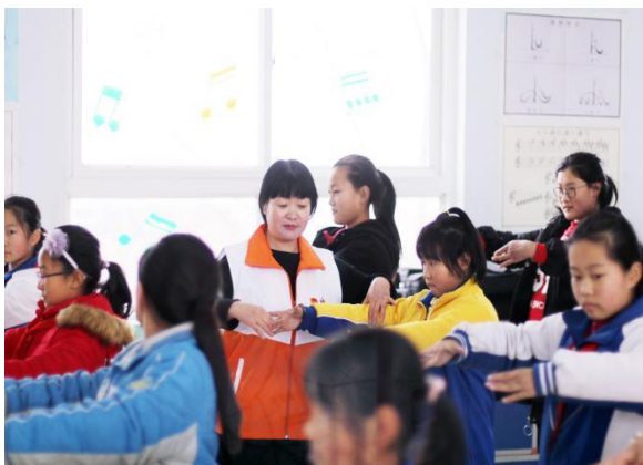
日照市洪凝社区儿童服务站七彩课堂讲授过程活动场景