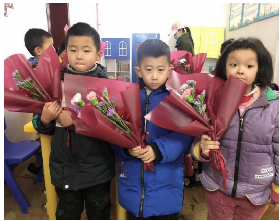
西杨社区儿童服务站“花语课”主题活动现场