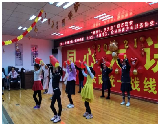
木城社区儿童服务站 | “迎新年、庆元旦”联欢晚会