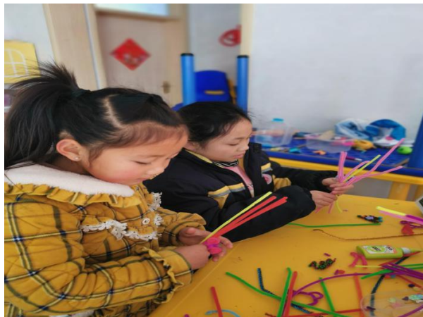
高庄村儿童服务站儿童手工制作活动现场