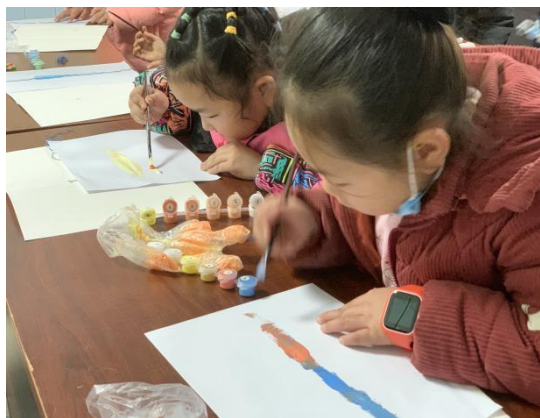
孩子们在进行创意童画现场绘制