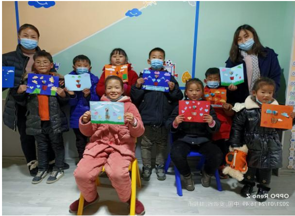
梅郢社区儿童服务站制作新年贺卡活动现场