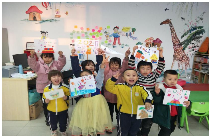
孩子们展示元旦绘画活动成果