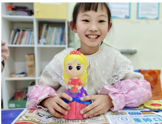
孩子开心的展示彩绘的石膏娃娃