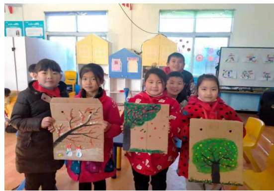
倒店中心小学儿童服务站“变废为宝”主题活动现场