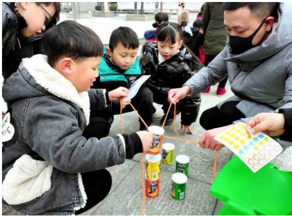
孩子们在进行元旦游园会活动中