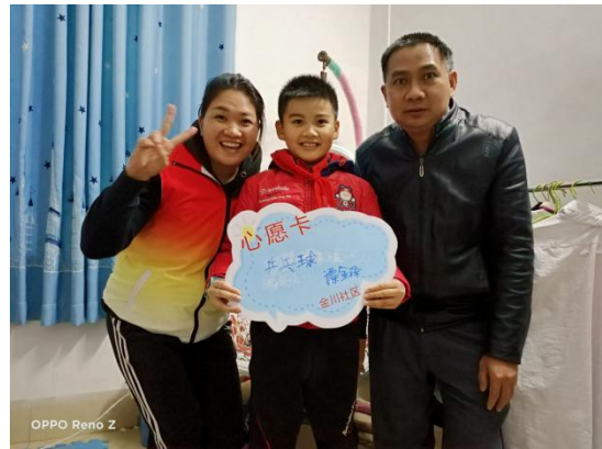
孩子们开心的展示心愿卡