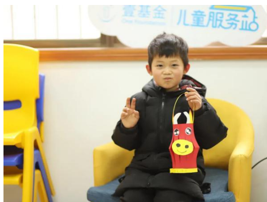
窑塘社区儿童服务站“创意手工之小牛灯笼”活动现场