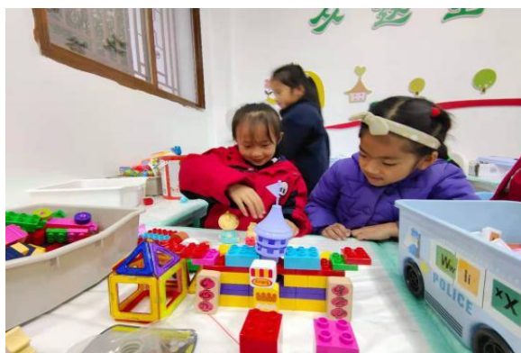
小河沟儿童服务站“搭积木”活动现场