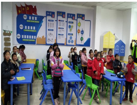
木城社区儿童服务站“七步洗手法”教育活动