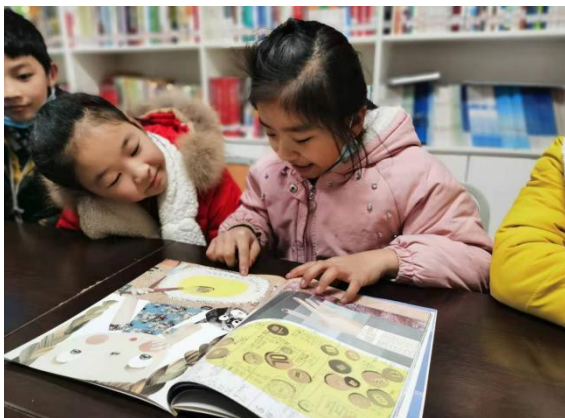
小朋友们在儿童服务站阅读书籍