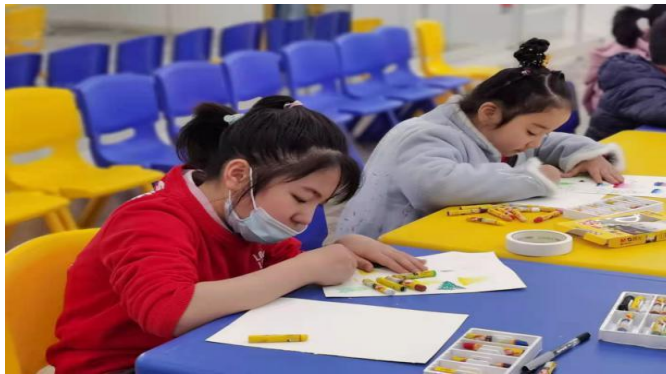
孩子们在参加“我是画画小能手”比赛当中