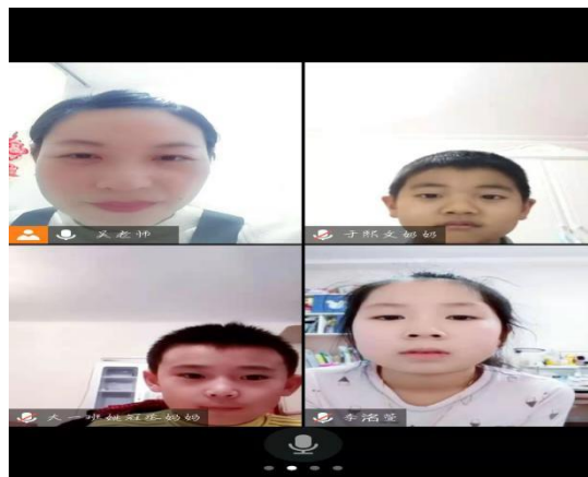
孩子们在线上参加趣味音乐课活动中