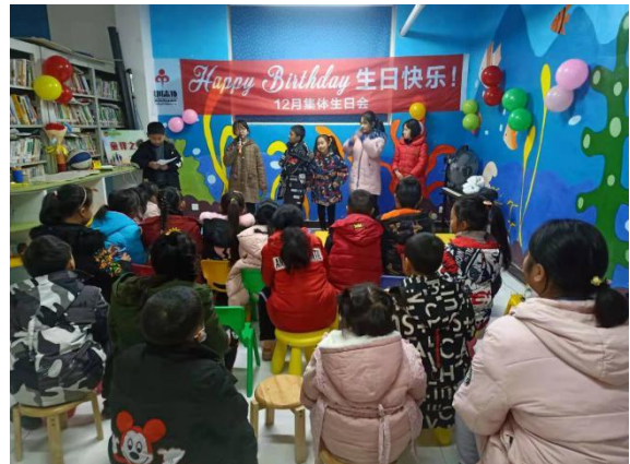
小朋友们在给站点其他小伙伴过生日中