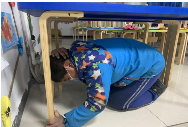
孩子在学习当地震来临时的应对方法