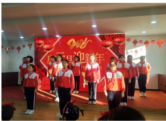
德州市东关社区儿童服务站庆元旦迎新年活动现场