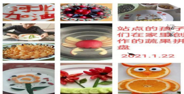
孩子们参加完“居家小拼盘”活动后的成果