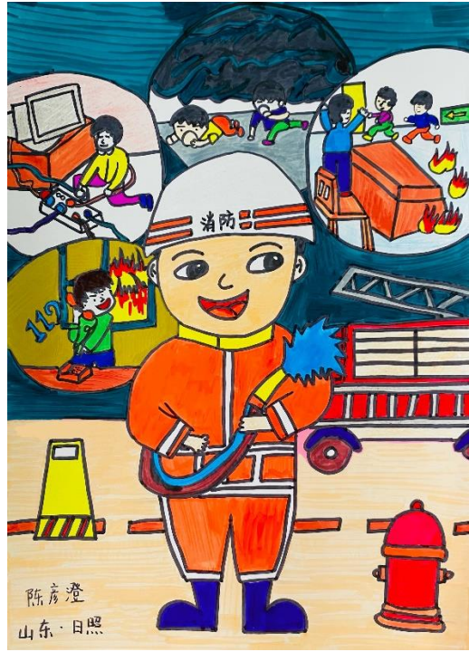
海报：陈彦澄 日照市新营小学 执行机构：日照市阳光助残志愿者协会