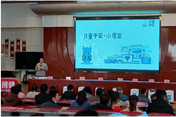
石嘴山市希望公益服务中心教师工作坊现场