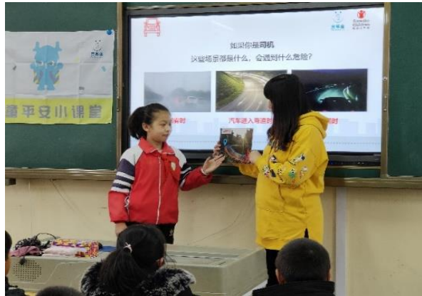
石嘴山第四小学的学生在交通课上分享 行人在山路弯道上过马路需要注意什么 执行机构：石嘴山希望公益服务中心

1月，湖北、湖南、黑龙江、广西及江西等地的伙伴共开展12场减灾主题活动，共有3795人次的孩子参与到活动中，通过游戏的方式学习安全知识和技能。安全知识不仅可以在课堂中学，也可在室外通过有趣、好玩的游戏活动来学习有效的安全知识。丰富多彩的减灾主题活动在1月的校园中轮番上演，演练心肺复苏、火灾场景中如何逃生，如何使用灭火器……一个又一个减灾主题活动以各种有趣又有效的活动形式在学校开展，让孩子们在游戏的过程中学习安全知识和技能。