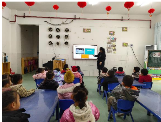
桔园社区开展交通安全课程