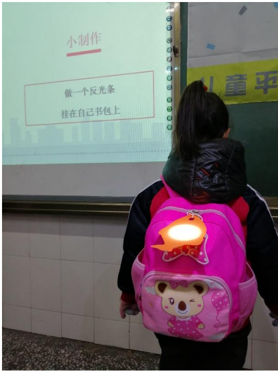
制作反光条：梁筱梅 公安县群力小学 执行机构：公安县辣妈酷爸爱心联盟