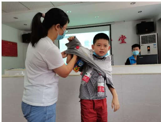
文汇社区的孩子们现场制作并试穿紧急救生衣