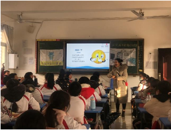
沙市南湖路中小学教师正在带大家 挑战憋气小活动 执行机构：荆州市沙市区党员志愿者协会