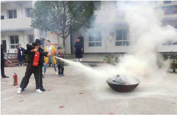
利川市腾龙小学学生在体验灭火器灭火