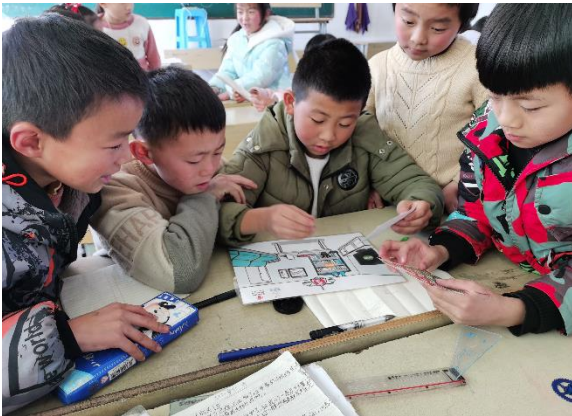
砂坝小学学生正在地震课堂上讨论 图片里容易倾倒、坠落和破碎的物品 执行机构：曲靖市初心社会工作服务中心