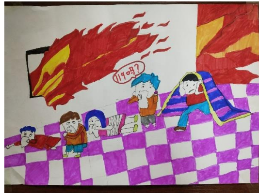
海报：徐艺纳 东港市碧海小学 执行机构：通城县义工协会