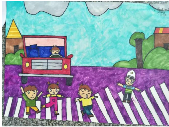
刘希含-三都小学-交通