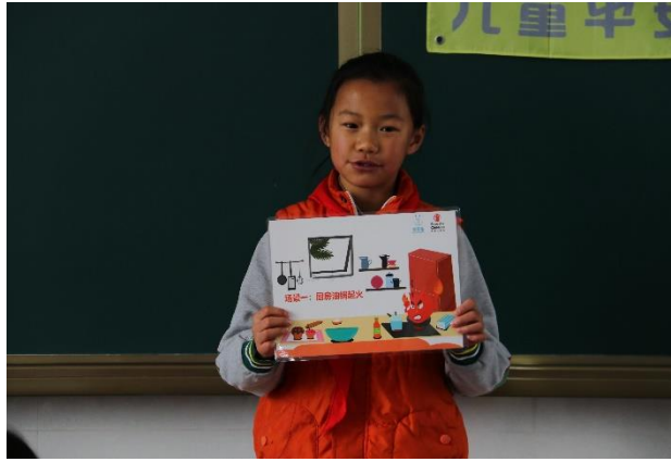
第四小学的学生在消防课堂上分享 面对厨房油锅起火的做法 执行机构：石嘴山希望公益服务中心