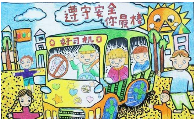
海报：佟欣芮 辽宁省凤城市凤山小学 执行机构：凤城市爱心义工协会