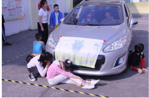
柳州市流山中心小学学生在体验车辆的视野盲区