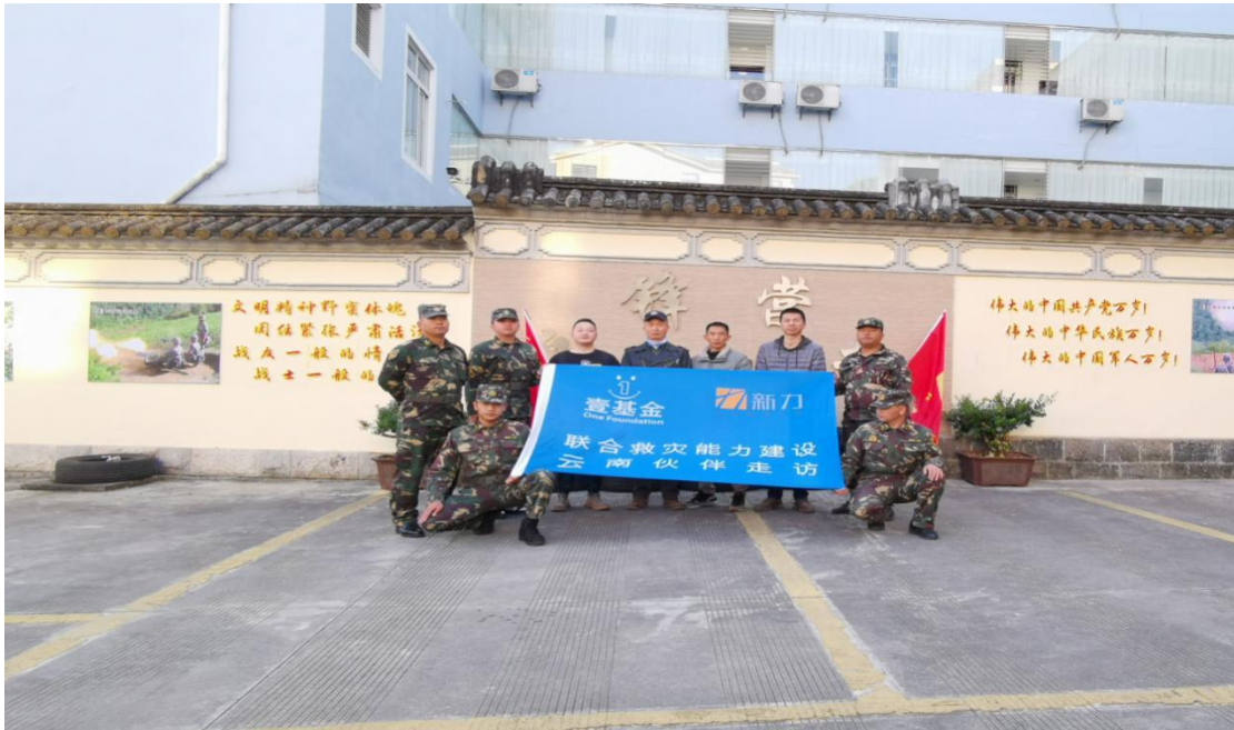
上图： 腾冲市青年志愿者协会活动合影

2021年1月29日，云南众益志愿者服务中心在保山市组织开展了伙伴走访，走访对象为保山市志愿者协会的社会组织，共5人参与。