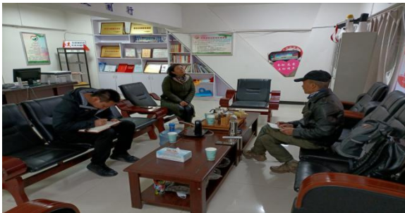
左图：寻甸绿芽志愿者协会走访交流

2021年1月13日，云南众益志愿者服务中心在寻甸县组织开展了伙伴走访，走访对象为寻甸绿芽志愿者协会的社会组织，共5人参与。