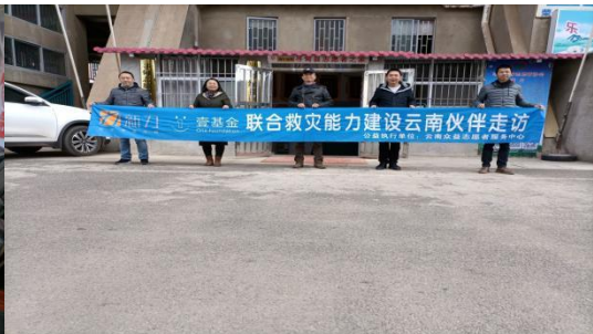
右图：寻甸绿芽志愿者协会走访合影

2021年1月28日，云南众益志愿者服务中心在腾冲市组织开展了伙伴走访，走访对象为腾冲市青年志愿者协会、腾冲市法律援助工作站、腾冲市腾越镇秀峰社区青少年事务社会工作服务中心、腾冲市希望公益服务中心、腾冲市教育发展公益服务中心等5家社会组织，共8人参与。