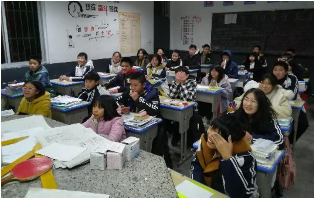
黄埠中学的同学在听演员秦一鸣老师的职业分享