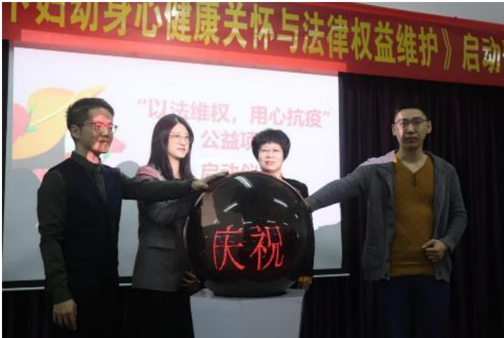
领导嘉宾点亮启动球