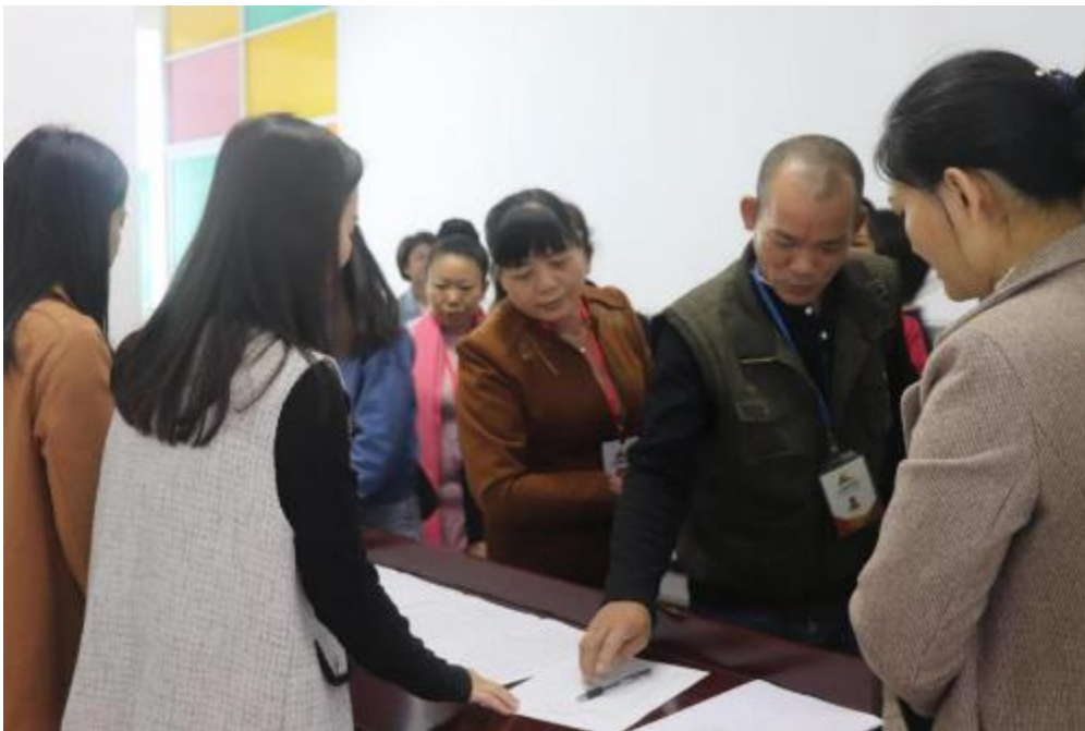
启动仪式参加人员签名