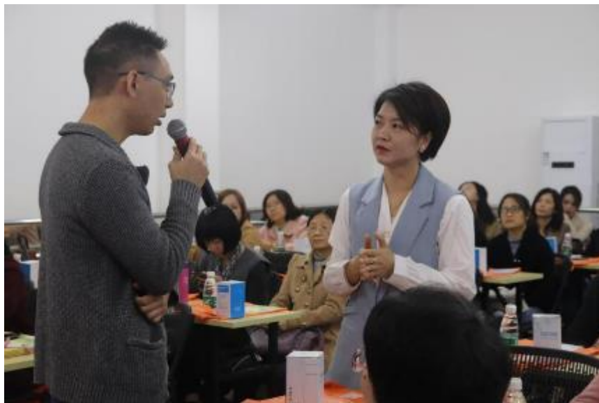
启动仪式暨讲座部分精彩剪影

12月，还完成了：（1）协调安排值班驻点人员进行值班服务。（2）公益讲师协调确定讲座主题和内容、时间，并制作相应的课件。（3）制作相应的宣传海报和报名链接。（4）和市妇联协商好其公众号档期，发布宣传免费咨询的公众号推文。并由森凯律所等公众号转发推广。