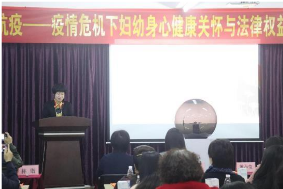
启动仪式上，潮州市妇联黄副主席发表讲话