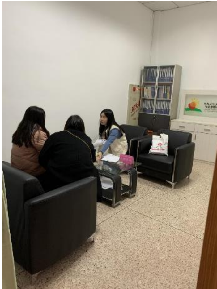
志愿者接待来访求助人员