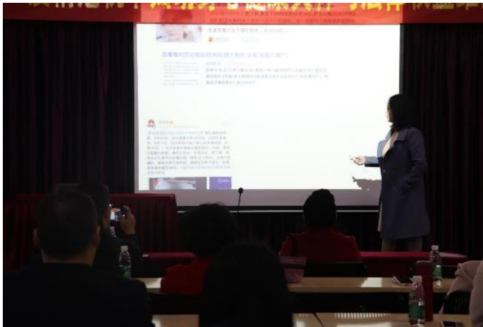
第二场法律心理主题讲座部分优秀剪影