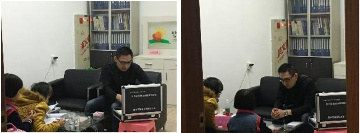
志愿者为求助小孩做心理评估