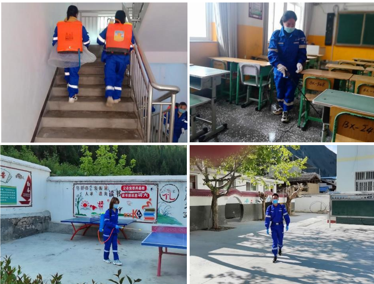
(2) 县应急局来访项目点

活动中，中寨村安全农家项目点社区志愿者救援队的队员们，分头开展消杀工作，队员们身穿队服，背起喷雾器，对学校教室、宿舍、餐厅、操场、卫生间、校门口周边环境等，所有师生可能会接触到的场所进行全方位的消毒，通过地毯式“消杀”，不留盲区死角，筑牢校园安全防疫“防火墙”，确保在校师生，有一个安全、健康、卫生的学习生活环境。