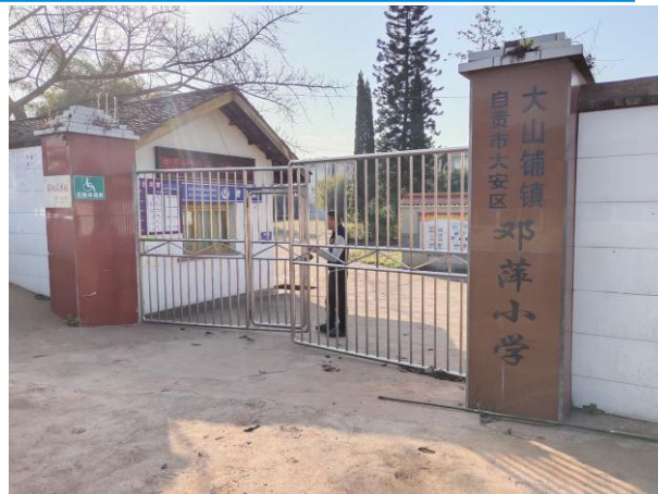
2020年3月，四川省自贡市执行伙伴选点2020年项目校