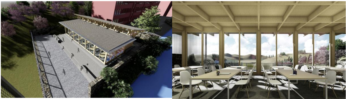
普安县高棉乡高棉小学部分效果图