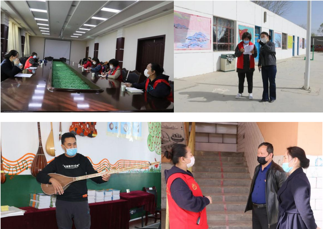
阿克苏市青年志愿者协会工作人员与阿克苏市教育和科学技术局进行项目座谈会及学校实地走访