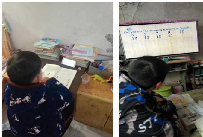
2020年3月，安徽杜集区开展线上教学