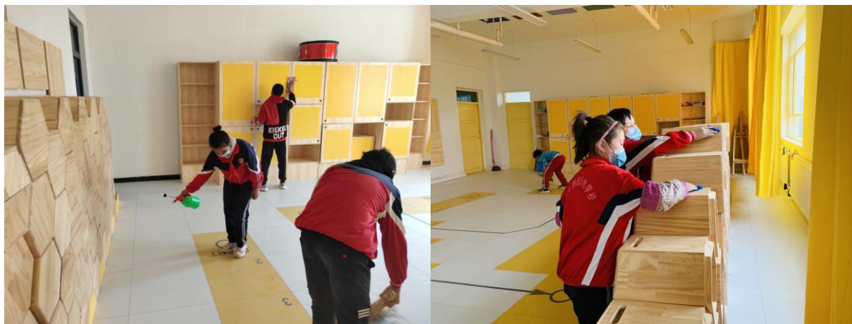
2020年3月，新疆乌什县壹乐园音乐教室项目校孩子清洁消毒

3月20日至23日，新疆乌什县各项目学校音乐教师与部分学生对音乐教室进行清洁与消杀工作，为开学正常使用音乐教室做好前期准备。