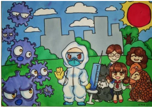
图一：“抗击疫情”主题活动；