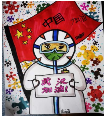
图二：疫情画作征集