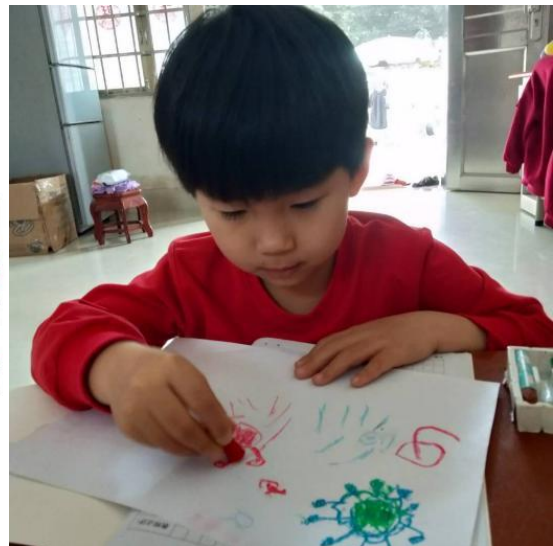
左图：育红巷社区儿童服务站，《我为战“疫”做贡献》线上主题活动