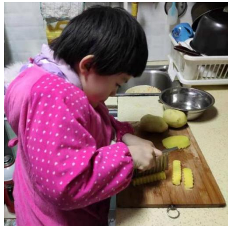
图二：“感恩”主题活动