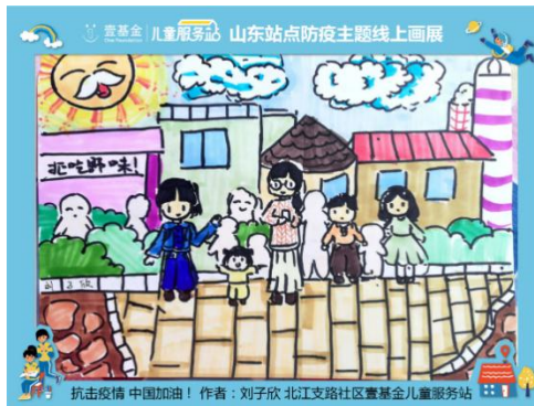
N0. 567 北江支路社区壹基金儿童服务站：开展主题防疫活动，社区儿童画作。