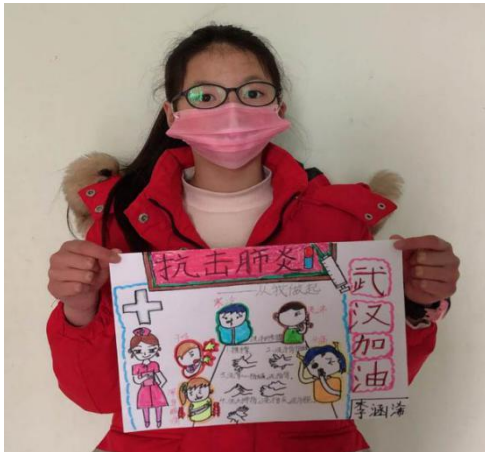
图一：抗疫主题活动