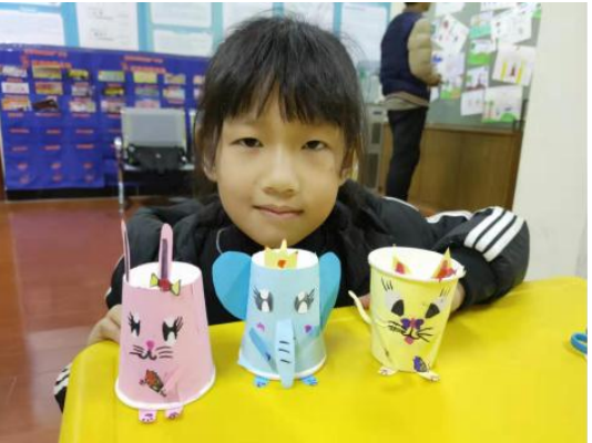
左 1：广善公益儿童服务站联合合肥斯达营地教育及家家景园社居委共同举办了“安全防拐小课堂”