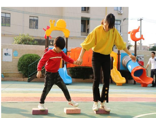
左 1: No. 407 育红巷社区儿童服务站-韶关市乐善义工会，防灾减灾主题活动