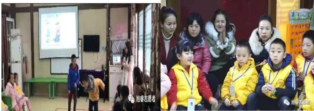
【水竹苑社区儿童服务站】拒绝校园暴力 传递校园正能量