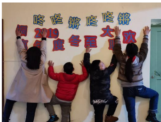
铜官儿童服务站, 冬至大联欢活动