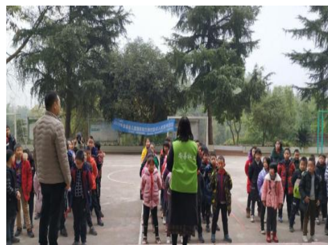
左 1: 2019 年 12 月, 乐山市弱涛村儿童服务站“防性侵”安全主题活动现场