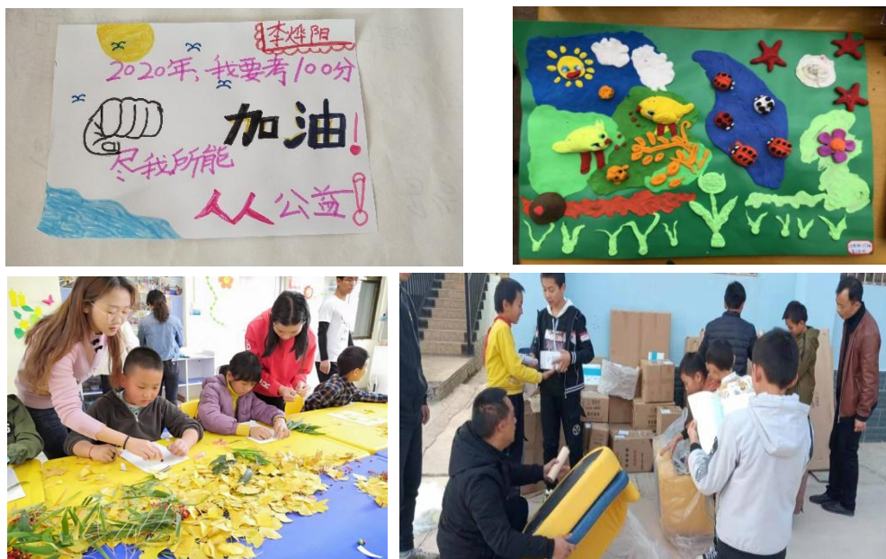
左 1: NO. 530 宾川社区站点，我爱写字活动

12月云南众益志愿者服务中心走访了曲靖站点，和站点工作人员沟通从开展活动的准备到活动后孩子的反馈做了详细的了解，准备做一期“走进传统文化”的活动设计给各个站点，最后评选活动开展最优秀的的站点。