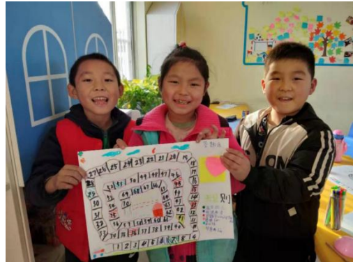
左图：N0.335 壹基金儿童服务站文昌街道站点