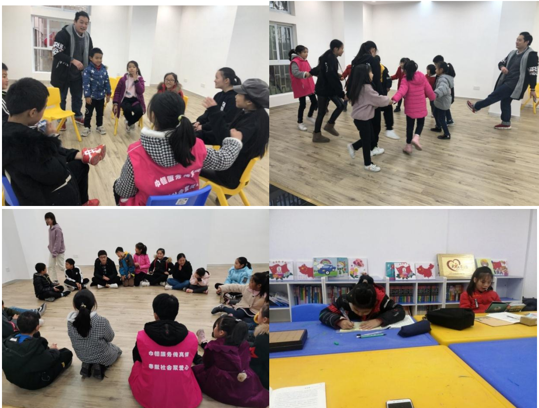
【崇贤社区儿童服务站】红色追梦小组、圆圈舞、大学生陪伴活动日常活动