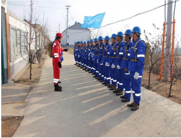
图：队伍训练后的合影