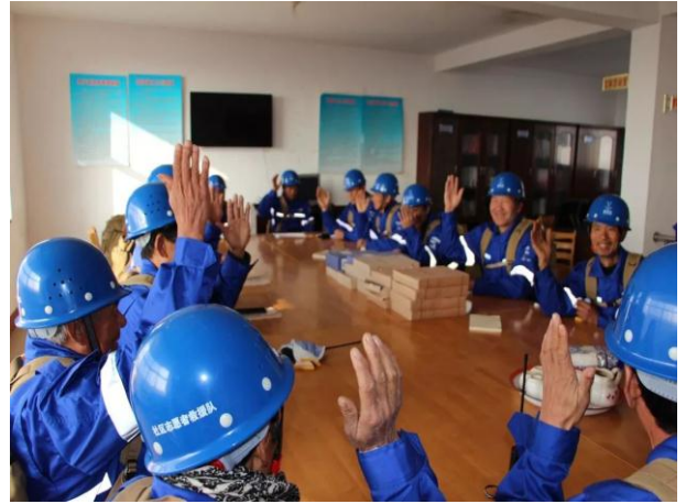
图：队伍刚成立仪式