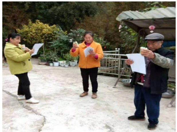
(2) 芦山县爱之家在芦阳镇项目进展