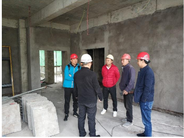
枣林幼儿园装修检查