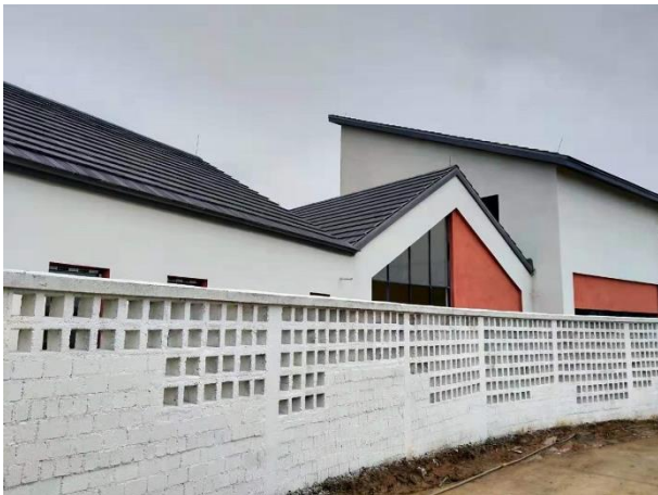
大坪幼儿园外墙涂料施工完成