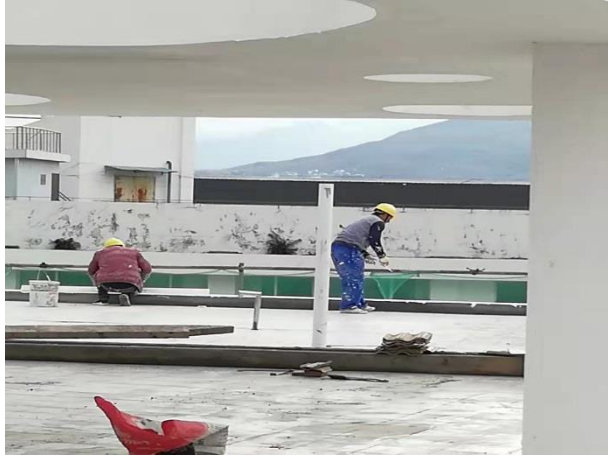
枣林幼儿园屋面地砖铺设