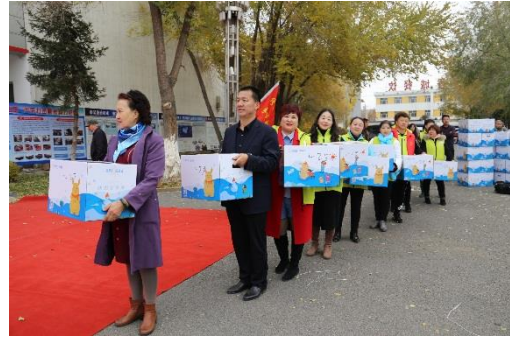
左图：志愿者们正从车上卸货；右图：温暖包分装活动现场